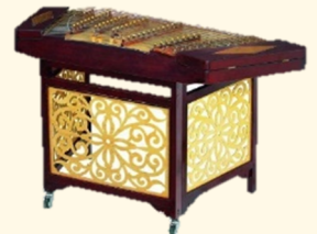
中国民族楽器「揚琴」