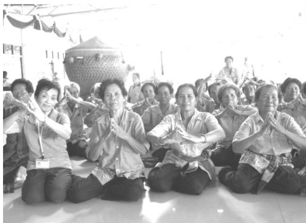
イサン (東北)：日本の脳トレーニングを紹介

8月26日(水)～30日(日)【27日は休館】 10時(初日 11時)～17時(最終日 16時) 赤穂市立図書館 1階 ギャラリー