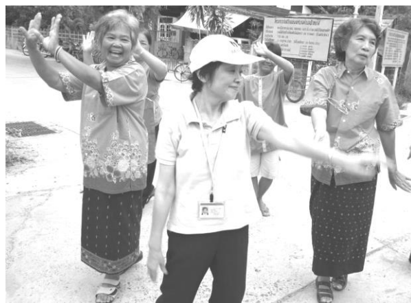
タイ国の高齢者運動を教えて貰い一緒に楽しむ