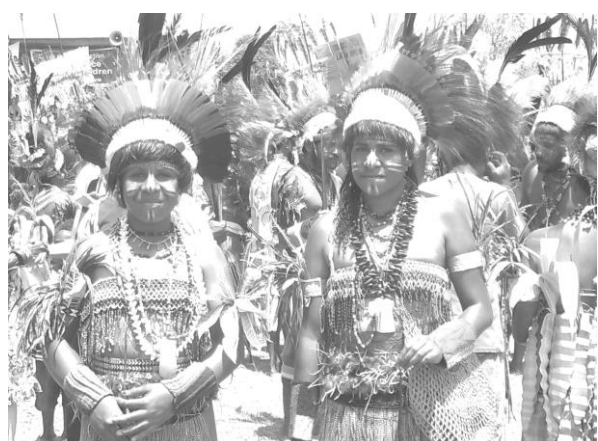
ゴロカショー：100以上の部族のダンスが披露される